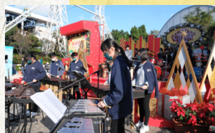
敲擊樂團海洋公園表演