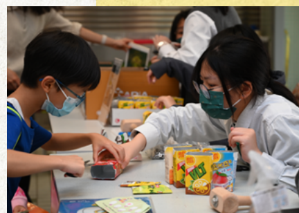
綠在港天環保市集