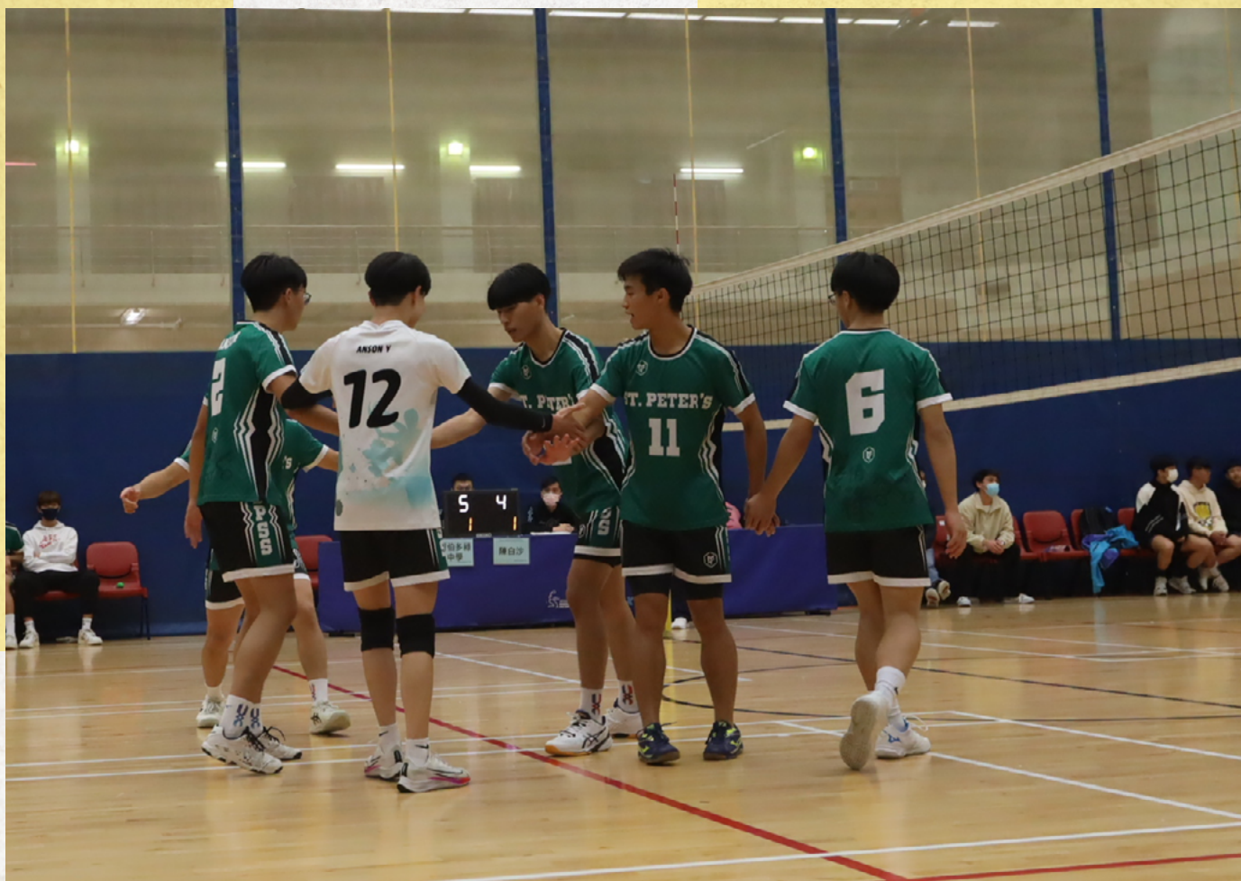
學界男子甲組排球決賽