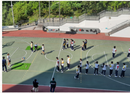
新興運動 -- 芬蘭木棋