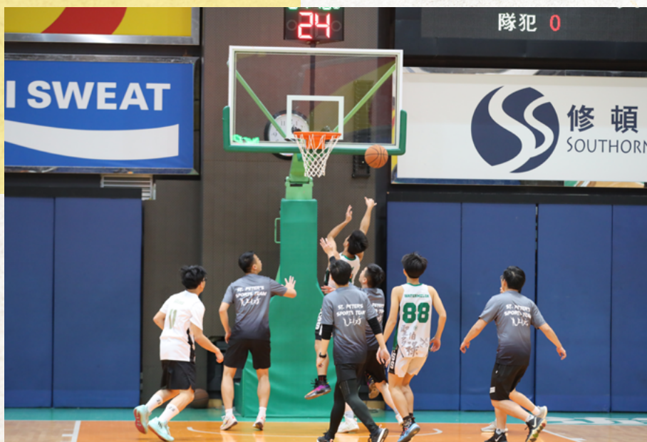
Say No To Drugs 活得精彩競技日師生籃球賽

不同平台，讓同學可展現其音樂及表演才能，如 BANDSHOW、TALENT SHOW 及海洋公園聖誕表演。最後，藝術上，本校亦提供木藝手作工作坊、欣賞電影藝術及美學等講座，讓學生培養美感。關心社群方面，本年度推行一人一服務計劃，亦舉辦了不少有關環保的社區服務活動，如回收月餅、海岸清潔及環保市集等，讓同學能先從保護環境出發，關心社區及地球所需。