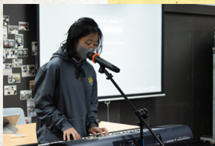
TALENT SHOW 初賽