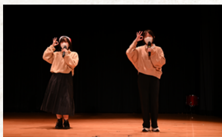
TALENT SHOW 決賽 -- 合唱