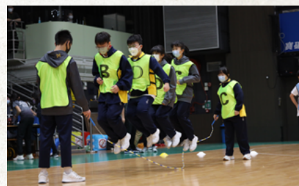
Say No To Drugs 活得精彩競技日班際比賽