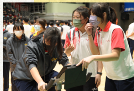
Say No To Drugs 活得精彩競技日社際單車接力賽