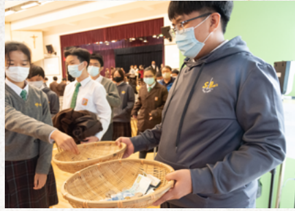
福傳音樂會助養兒童籌款