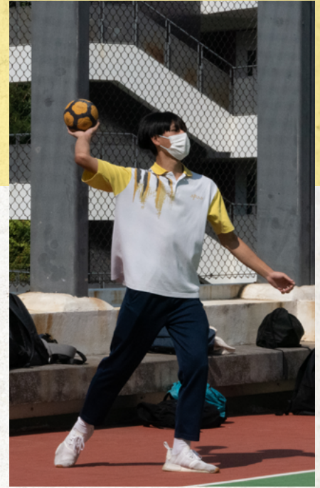
新興運動 -- 巧固球