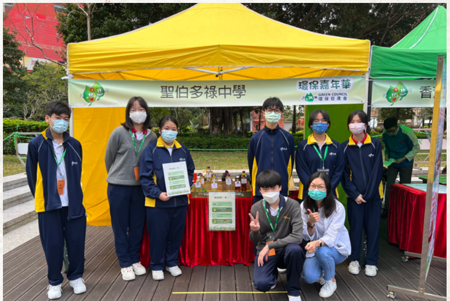
環境學會環保嘉年華會