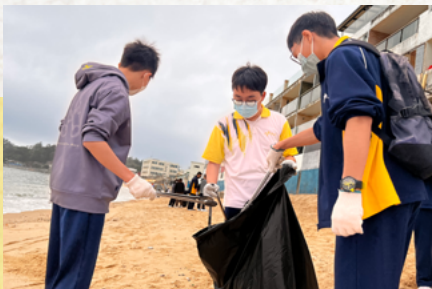
環境學會中秋月餅回收行動