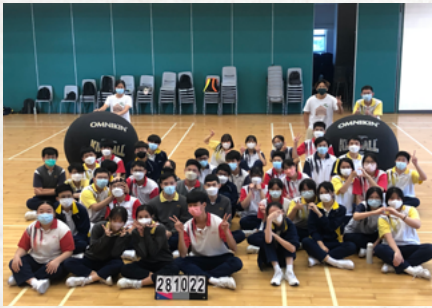
新興運動 -- 健球