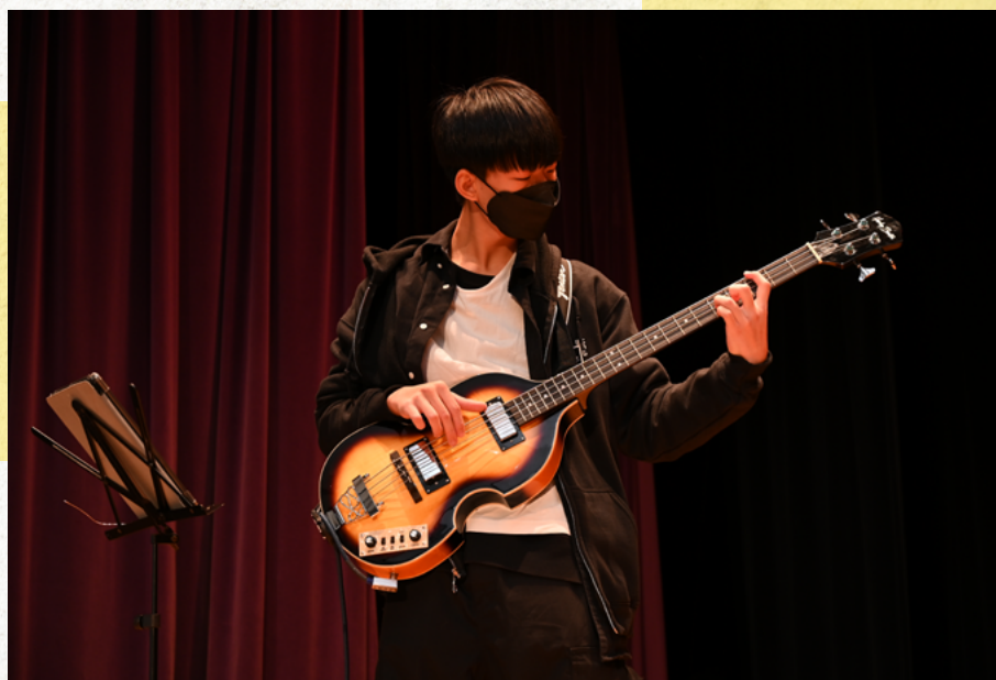
TALENT SHOW 決賽 -- 流行樂隊