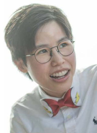
國立台灣大學文學院學士(哲學) 英國布里斯托大學 社會與文化理論學碩士

不少人可能對於在台升學存有疑問，擔憂認受性不足。的確，台灣大學數量眾多，質素參差不齊，但我認為優質的學校仍是為數不少的，所以同學們在決定赴台留學前必須要作全面的資料蒐集，謹慎選擇學校，並作充足的準備以求能入讀心儀的學校。在異鄉求學，或許難免偶感思鄉，惆悵不安，但萬萬不要因畏懼艱難而放棄追尋夢想，要謹記你所經歷的種種，所咬緊牙關付出的一切努力，這些寶貴的歷練都將成就未來的那個「你」。